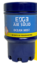
Ocean Mist E102203