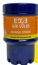
Mango Citrus E102201