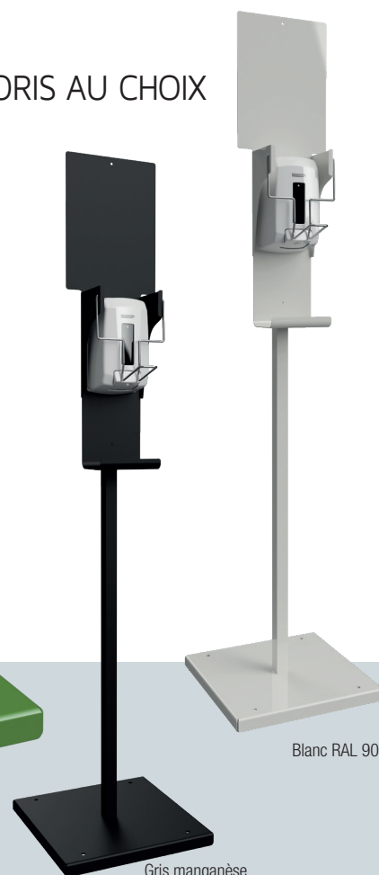
Blanc RAL 9016