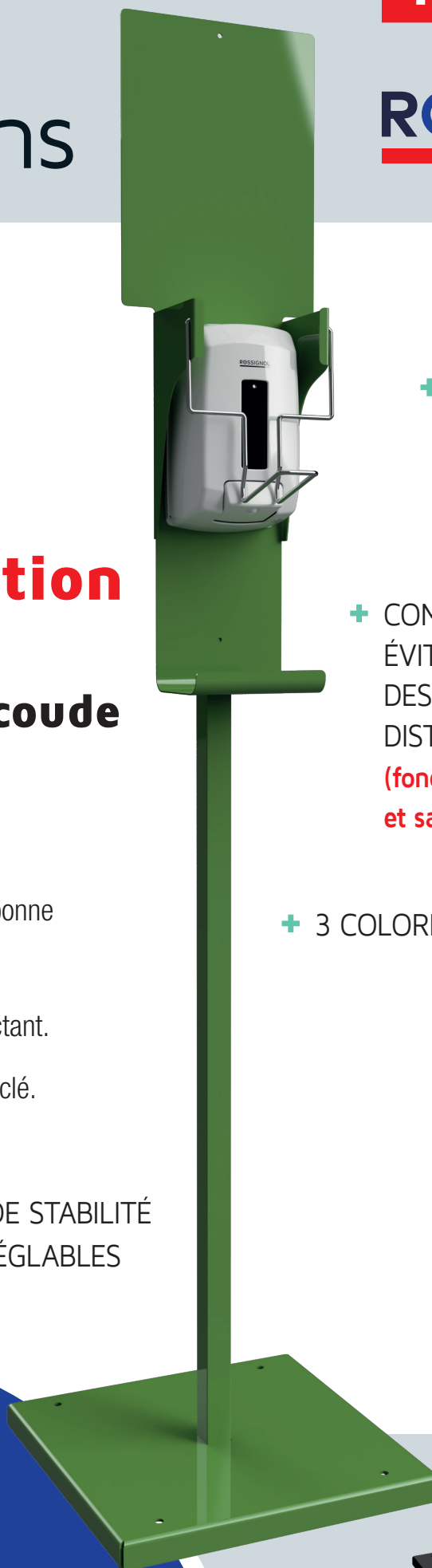
Vert jaune RAL 6018